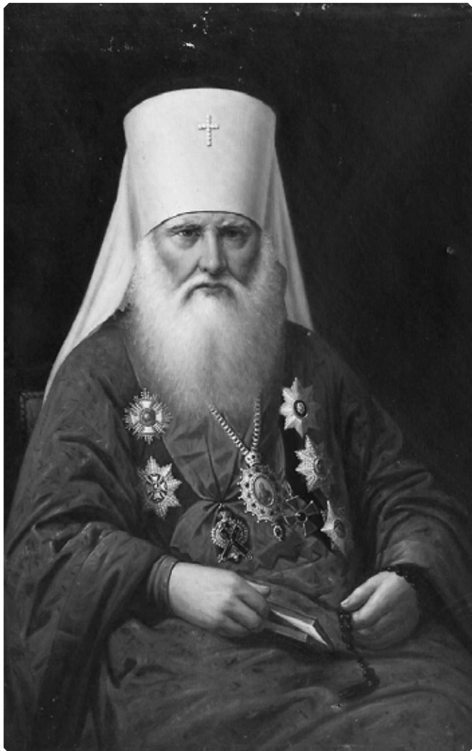
Митрополит Киевский и Галицкий Платон (Городецкий)

ведомости» за 1890 г.: «окрестные жители имеют особое благоговение к этой святыне и во время народных бедствий: засух, саранчи и эпидемической болезни – просят для молебствия в свои жилища».