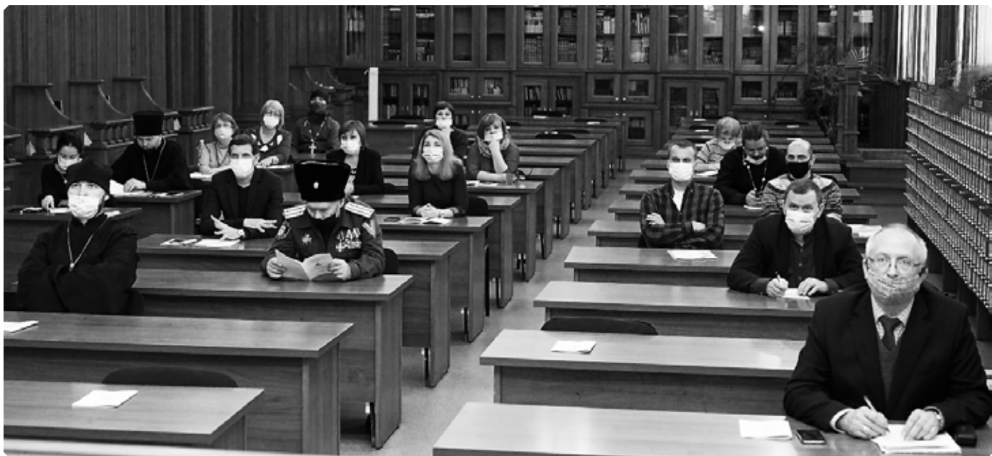
Участники пленарного заседания Покровских чтений.

Сергия, митрополита Барнаульского и Алтайского. Обращаясь по видеосвязи к участникам заседания, глава Алтайской митрополии отметил выдающуюся роль святого благоверного князя Александра Невского в сохранении российской государственности, культурных традиций нашей страны и православной веры. Митрополит Сергей подчеркнул чрезвычайную актуальность обращения к духовному наследию великого князя: