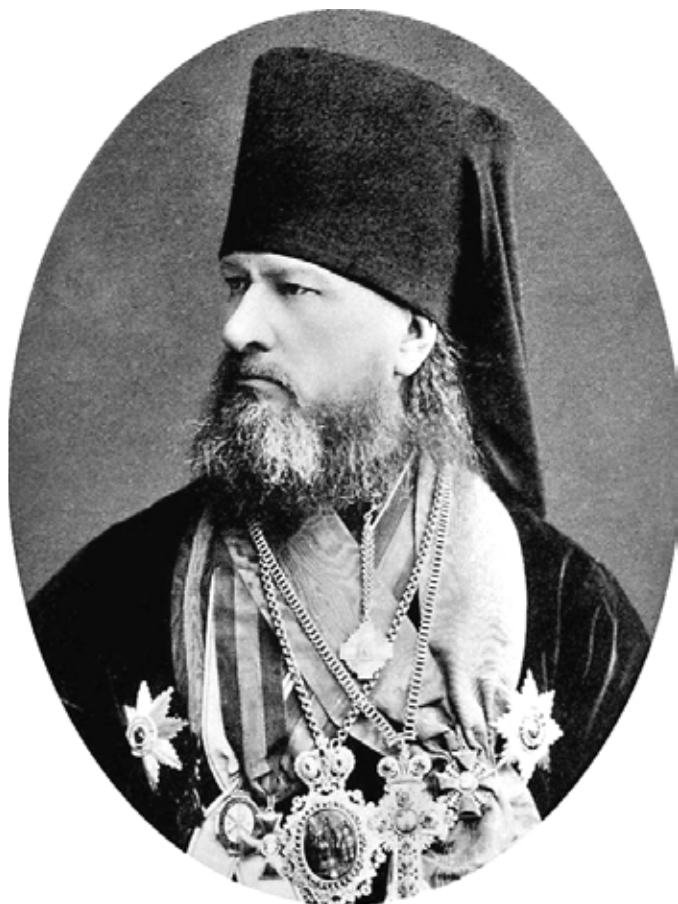
Епископ Исаакий (Положенский). С 8 марта 1886 г. по 12 января 1891 г. – епископ Томский и Семипалатинский

В «Отчете об Алтайской и Киргизской миссиях Томской епархии за 1888 год» сказано, что в настоящем отчетном году он «окончен постройкою, весь каменный.., с таковою же церковью. Библиотека и имущество приобретены вновь; церковь в мезонине, хотя по размерам своим далеко не равняется прежней, но... име-