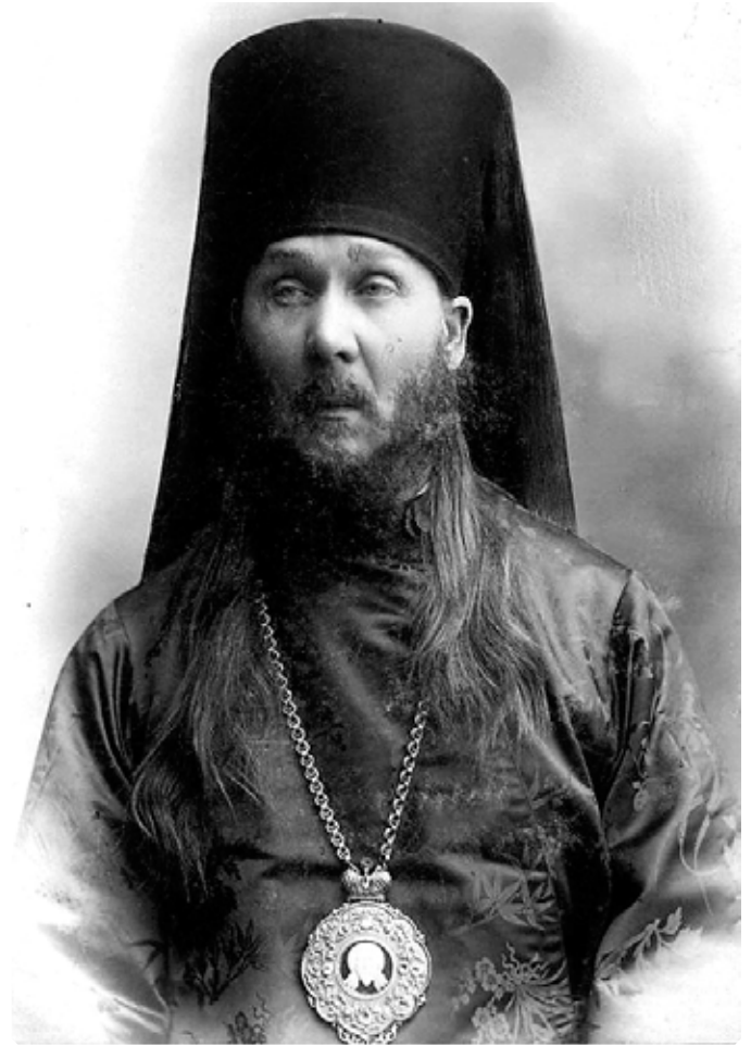
Преосвященнейший Мефодий (Герасимов), епископ Бийский. 1898 г.

«По журнальному определению Консистории, утвержденному Его Высокопреосвященством, Высокопреосвященнейшим Макарием от 11 октября сего года за № 3861, священник