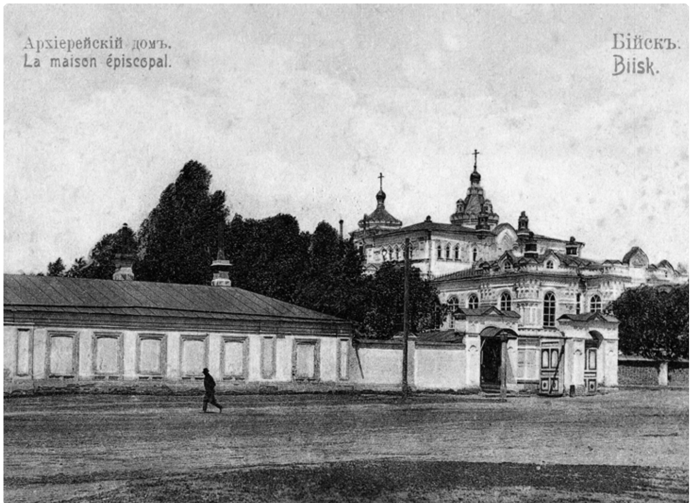
Бийский архиерейский дом. Почтовая карточка. Начало 1900 г. БКМ

В минувшие годы 19 января православное население Томска в большом количестве собиралось в домовую архиерейскую церковь помолиться с Владыкой Макарием в день его именин и с ним вместе разделить дорогие ему воспоминания о воспитавшей его Алтайской миссии.